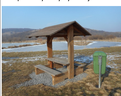
Ilustr. obrázek, foto posezení v Nesovicích

V průběhu prázdnin byl proveden výběr dodavatelů. Párty stany, pivní sety, odpadkové koše a lavičky dodá firma Eurostany s.r.o. z Nesvačilk. K dispozici by měly být v nejbližších dnech.