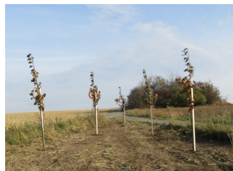
Foto: Výsadba stromků v obci Dobročkovice

Výsadba stromků již proběhla v obcích Dobročkovice, Brankovice, Chvalkovice, Milonice, Nemochovice a Snovídky.